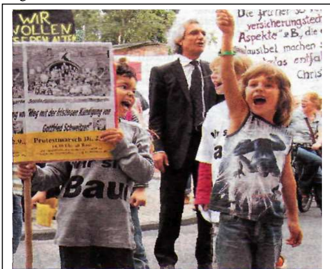
Baui-Kinder am 4.9.08