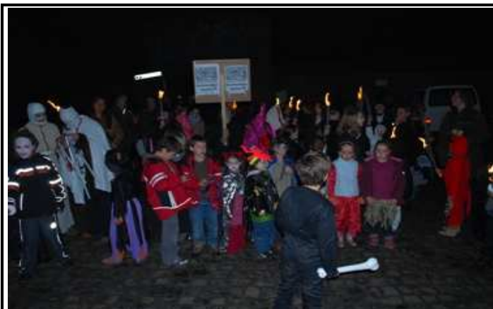
Halloween 31.10.: Vertreibung böser Geister